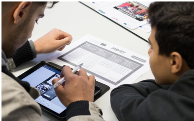
Abbildung 1 Arbeiten mit dem Tablet

In Kleingruppen erarbeiten die Schüler/innen die Inhalte ihres Fake-News-Checks. Sie visualisieren ihn in Form eines Plakats, welches sie mit dem Tablet und einer entsprechenden App gestalten.